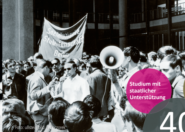
1967: Demonstrationen zum Tod von Benno Ohnesorg.