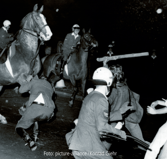
1968: Ausschreitungen bei einer Demonstration der APO.